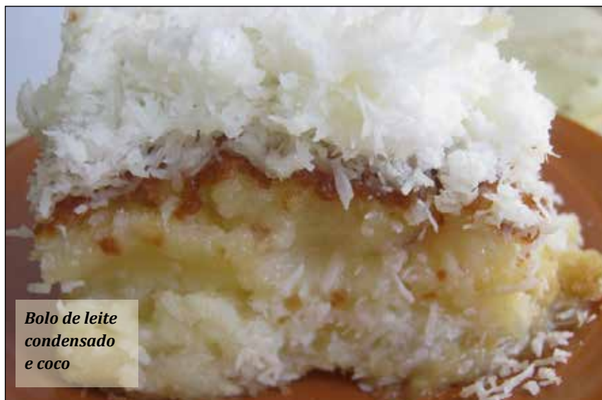
Bolo de leite condensado e coco

O bolo deve ficar com consistência de uma queijadinha.