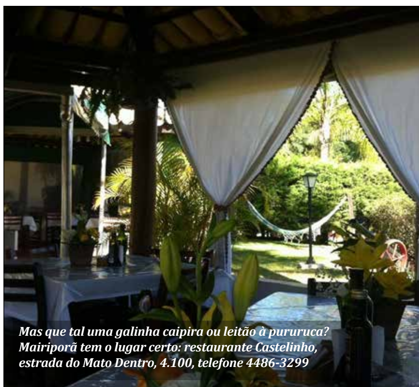
Mas que tal uma galinha caipira ou leitão à pururuca? Mairiporã tem o lugar certo: restaurante Castelinho, estrada do Mato Dentro, 4.100, telefone 4486-3299

Depois de recheado cubra-o com o restante da massa e leve ao forno médio por 20 minutos ou até dourar.