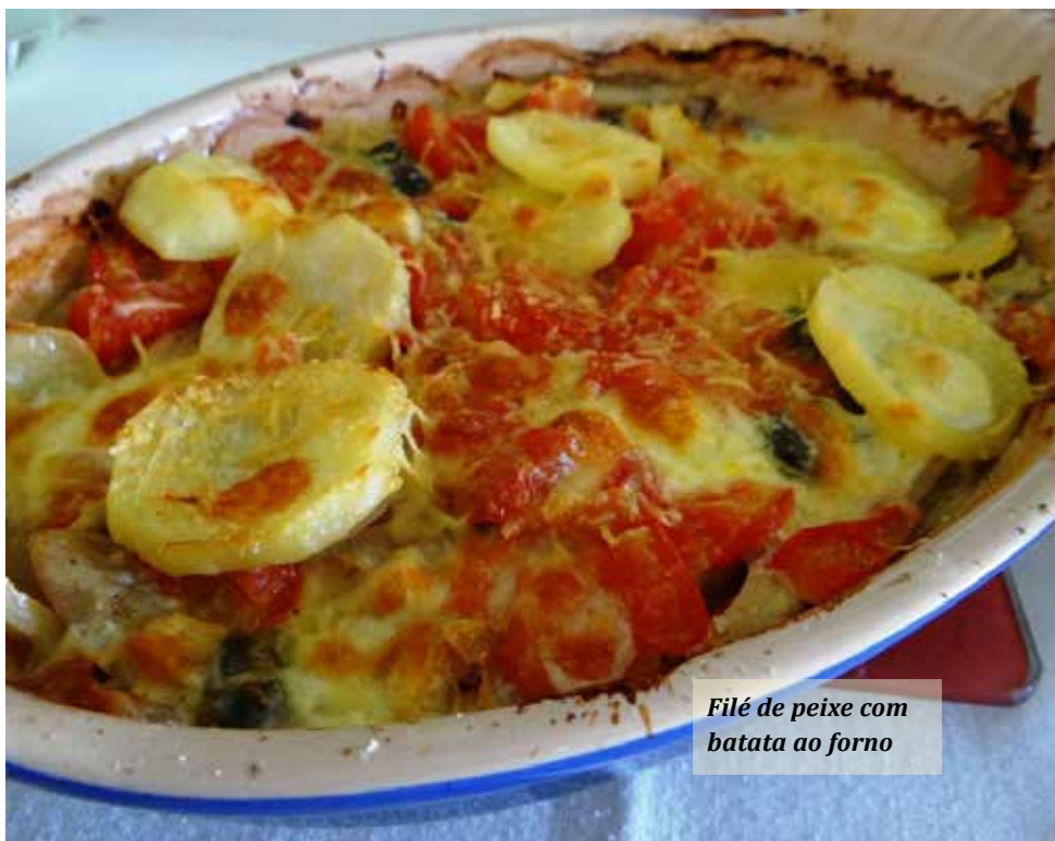
Filé de peixe com batata ao forno

Corte as batatas em rodela com cerca de 1cm de espessura, temperadas com sal e pimenta do reino e coloque-as em um