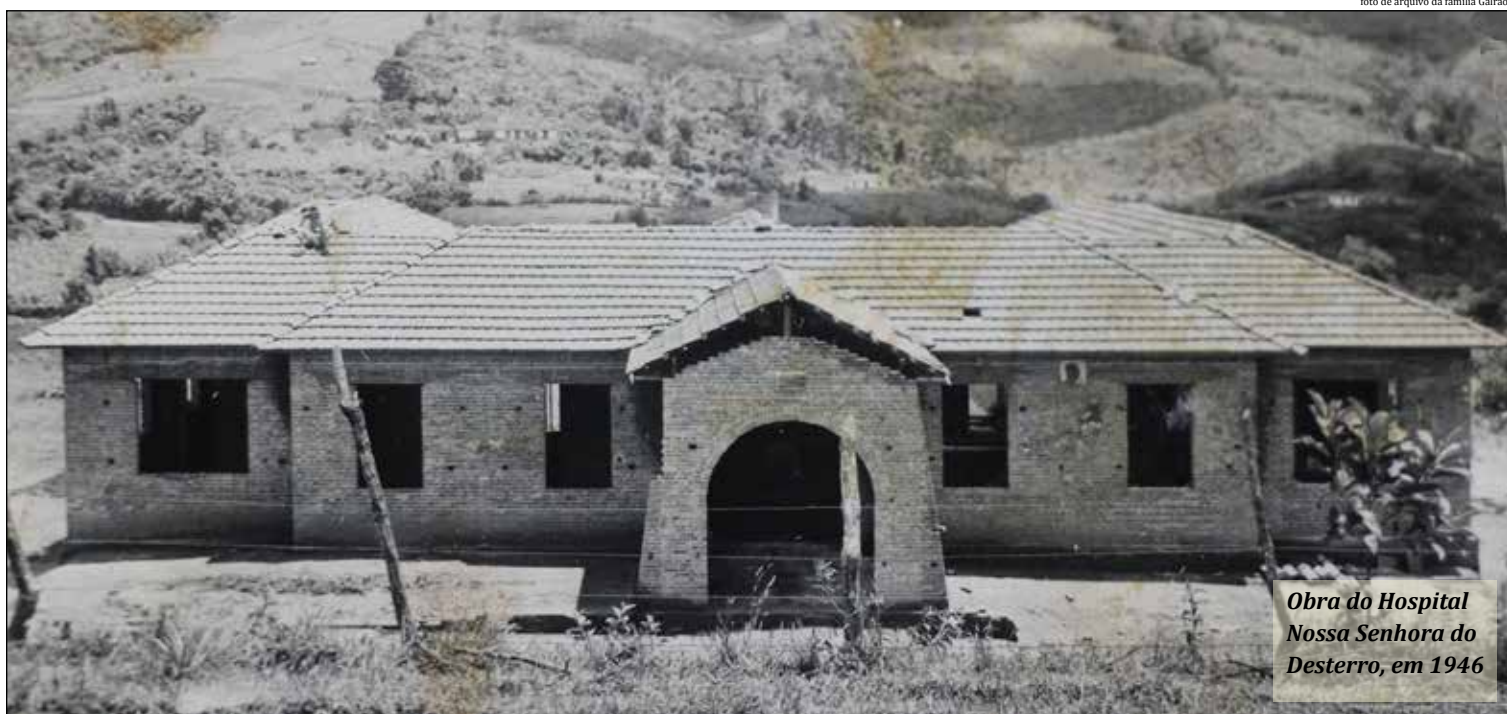
Obra do Hospital Nossa Senhora do Desterro, em 1946