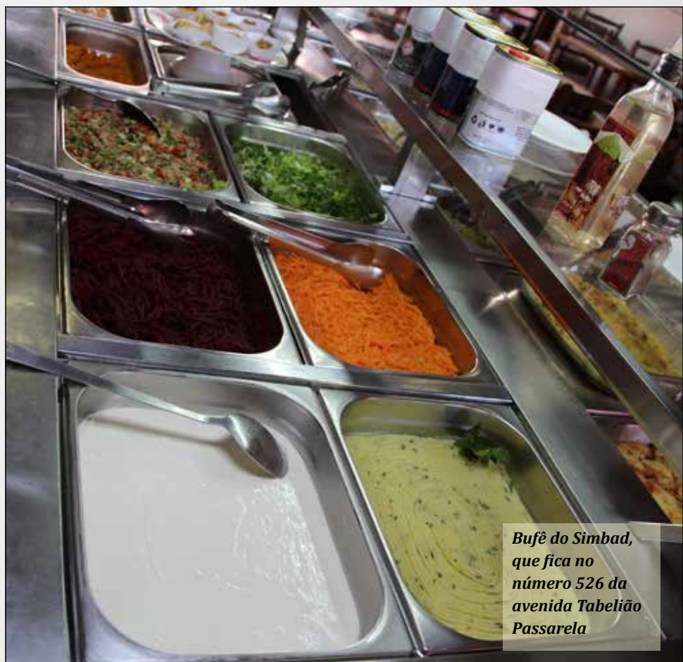
Bufê do Simbad, que fica no número 526 da avenida Tabelaão Passarela

O povo precisa se politizar e cobrar os seus direitos. A sociedade de Mairiporã precisa buscar sua cidadania.